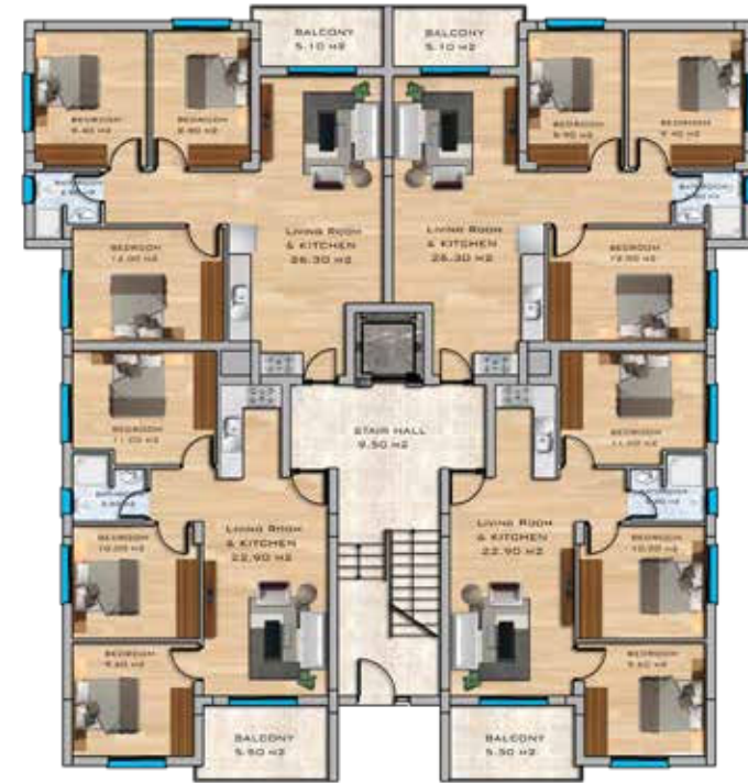
3+1 Apartments Ground Floor Plan