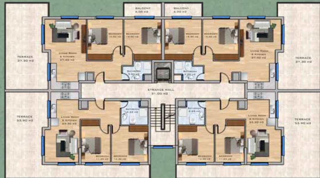
Penthouse Floor Plan