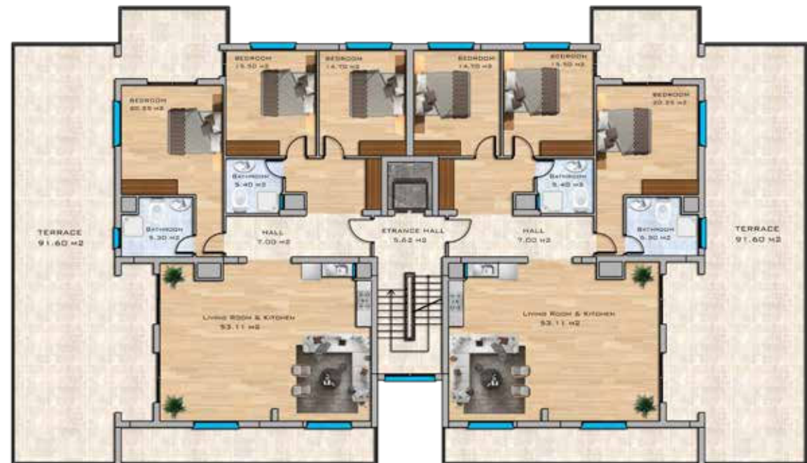
Penthouse Floor Plan