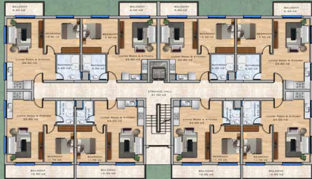
1+1 Apartments First Floor Plan