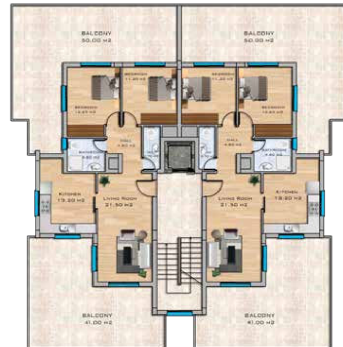
Penthouse Floor Plan