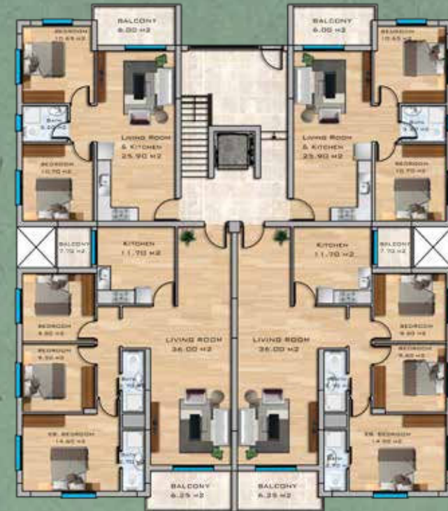
2+1, 3+1 Apartments Ground Floor Plan