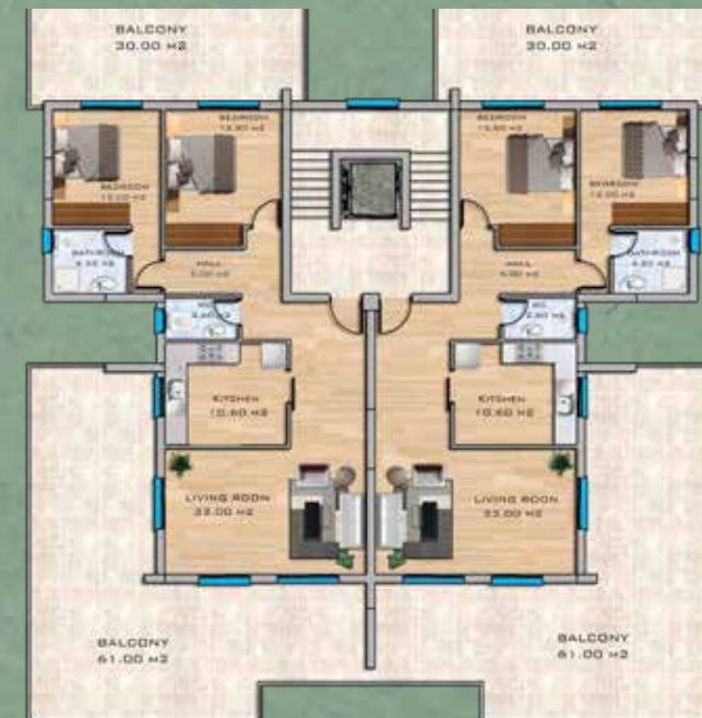
Penthouse Floor Plan