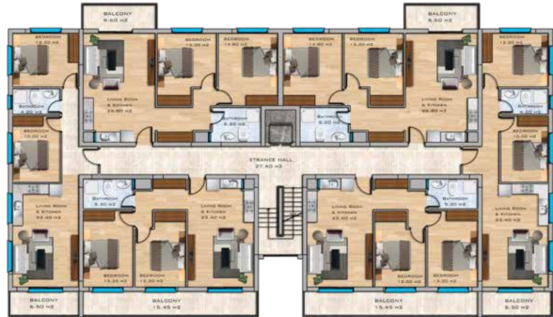
2+1 Apartments First Floor Plan